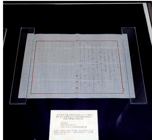
お茶の水女子大学長宛て宮内庁長官通知(昭和24年10月15日) 「皇后陛下お茶の水女子大学において挙行の創立七十五周年並びに同大学開学記念式へ行啓の節賜れる御言葉」