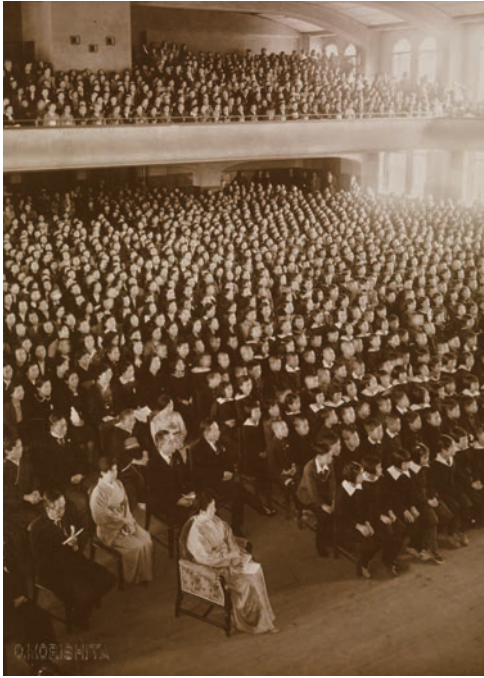
記念式に続いておこなわれた学芸会の様子

1949 (昭和24) 年は、1875 (明治8) 年の東京女子師範学校創立から75年目にあたり、また新制大学お茶の水女子大学開学の年でもあったことから、11月5日、皇后を迎えて「東京女子高等師範学校創立七十五周年お茶の水女子大学開学記念式」が挙行されました。当日は在学生に加え、500名近くの桜蔭会員が参加しました。本学の新しい門出を祝すかのごとき快晴に恵まれたといえます。