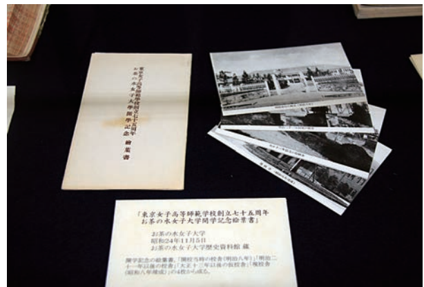
「東京女子高等師範学校創立七十五周年お茶の水女子大学開学記念式次第」 「式典並祝賀会概要」 「東京女子高等師範学校創立七十五周年お茶の水女子大学開学記念絵葉書」