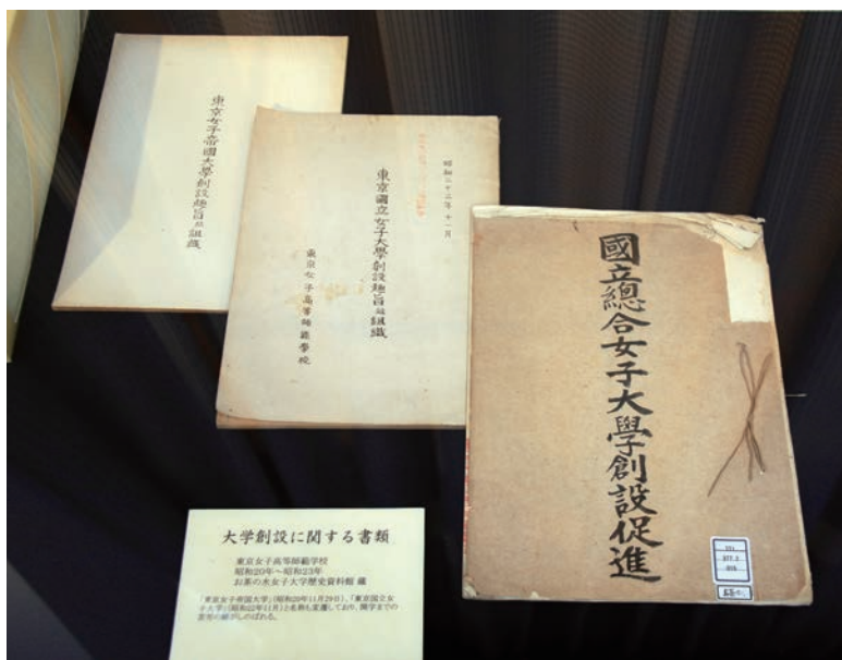
『東京女子帝国大学創設趣旨並組織』（昭和20年11月29日）

なお、茶の花に「大学」と記した大学徽章は、50年、学生投票によって決定されたものです。