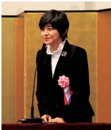
式典挨拶 板東久美子文部科学省生涯学習政策局長（前内閣府男女共同参画局長）