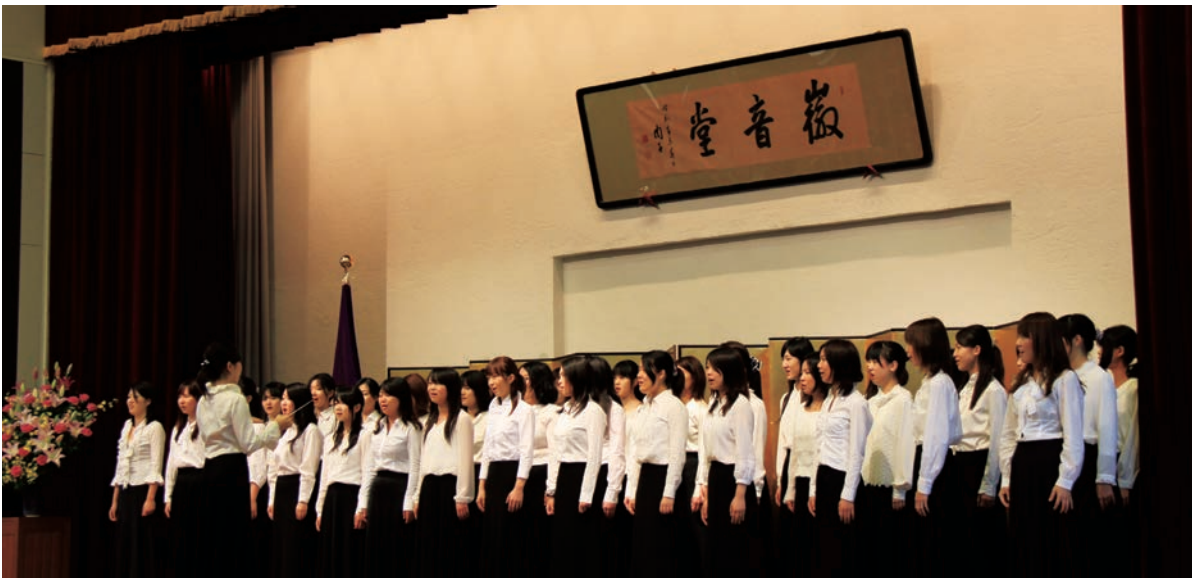
校歌「みがかずば」合唱 文教育学部芸術・表現行動学科音楽表現コース