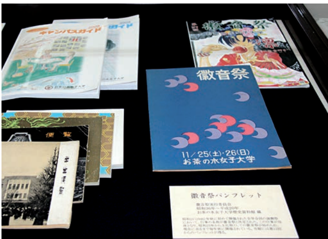
徽音祭パンフレット（昭和36年～平成20年）

第一回徽音祭は、1950（昭和25）年に開催されました。しかし、その起源は、46年に開催された文・理・家政・体育各科競演の演劇祭にあるようです。このとき、在校生の圧倒的な支持により、講堂・徽音堂に由来する「徽音祭」との名称が決定されたとのこと。以来、現在にいたるまで、徽音祭は学生たちのさまざまな活動の発表の場として、年々華やかさを増しながら、一度もとだえることなく開催され続けています。