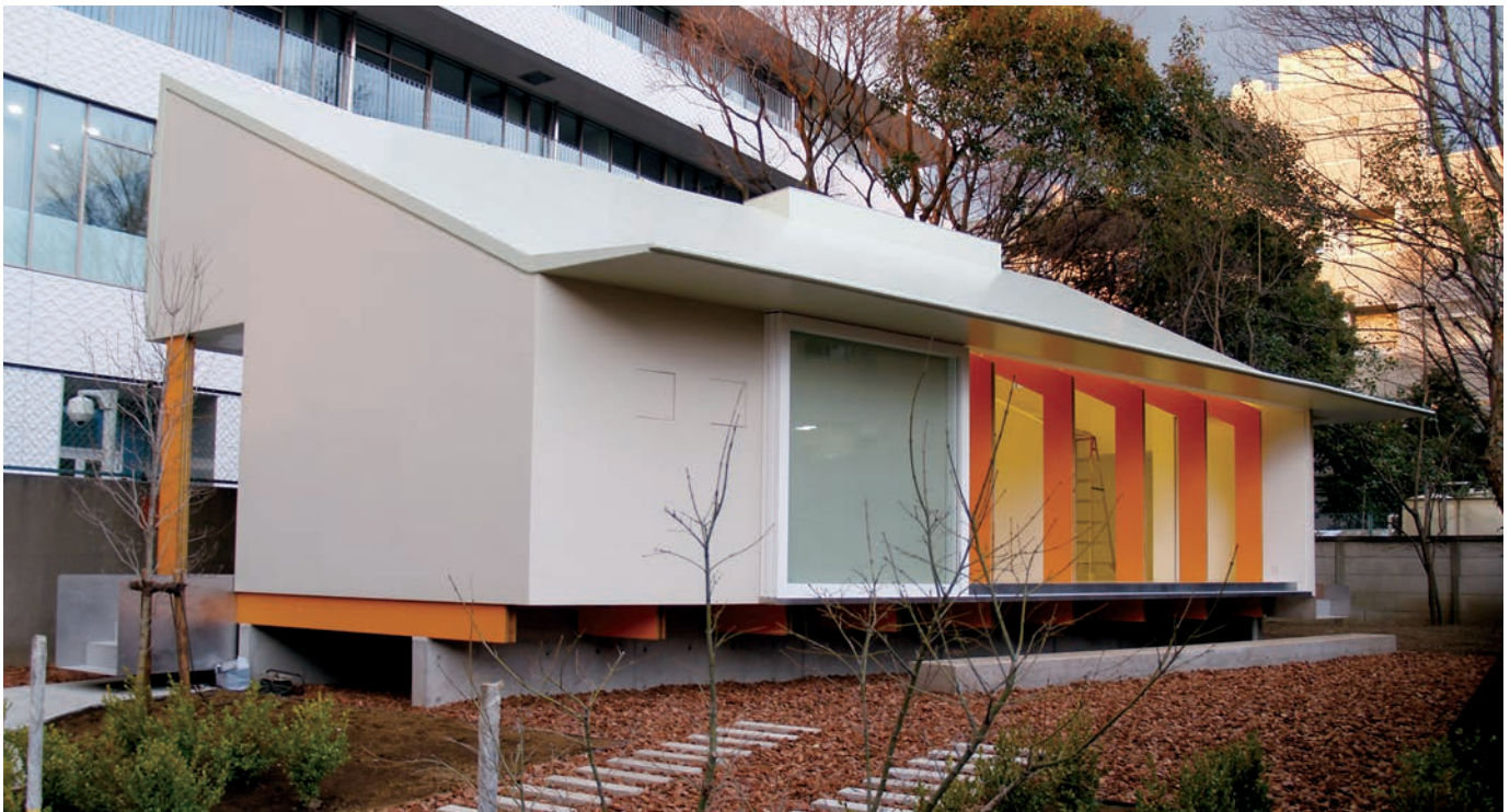
ユビキタスコンピューティング実験住宅「Ocha House」