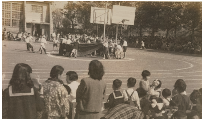
「お茶の水女子大学開学記念東京女子高等師範学校創立七十五周年アルバム」