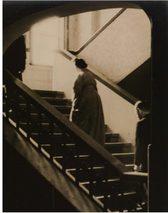
本館内を歩く香淳皇后