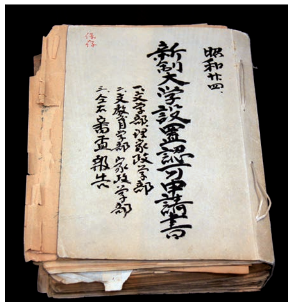
「新制大学設置認可申請書」（昭和24年）