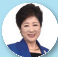
東京都知事 小池 百合子